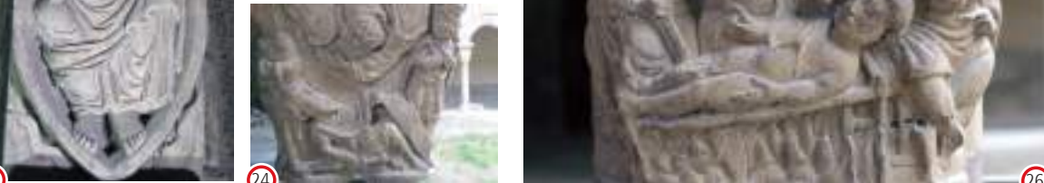
(22) (S.) La Virgen y los discípulos (24) Ananías cura a San Pablo (27) Martirio de San Andrés (30) El baile de Salomé (E.)