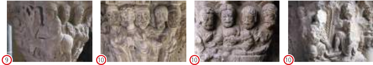
(9) Entrada en Jerusalén (10) (N-E.) Traición de Judas (10) (S.) Última Cena (10) (O.) Lavatorio (10)