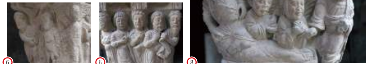
(6) (O.) Bautizo de Jesús (6) (E.) Predicación del Bautista (6)