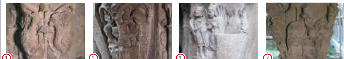
(N.) Gallos (1) (E.) Natividad (1) (S.) Visitación y Anunciación (1) Epifanía (2)