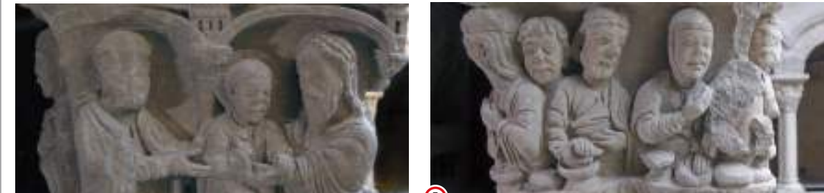
(5) Bodas de Caná