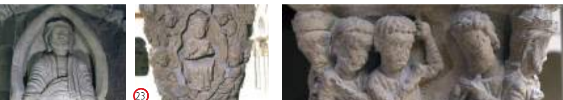
(22) (S.sup) Pantocrátor (23) Asunción de la Virgen (24) San Pablo en el camino de Damasco (26) Martirio de San Lorenzo