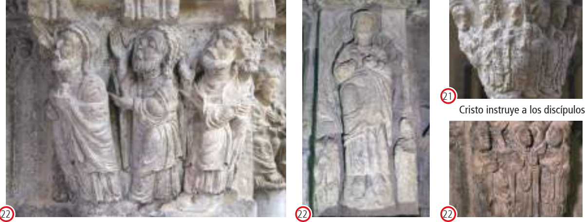
(22) (E.) Ascensión de Cristo (22) (E.sup) Cristo en Majestad (22) (O.) La Virgen y los discípulos en el cenáculo