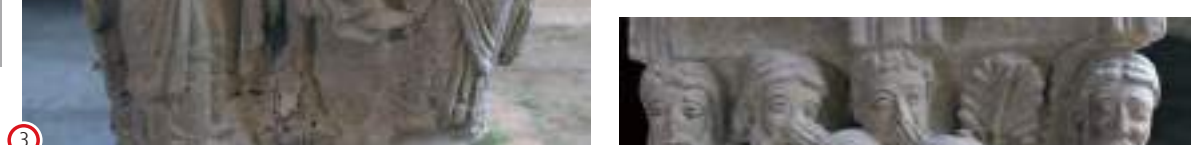
(3) Presentación en el Templo