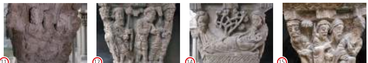
(11) La Oración en el Huerto (12) El Prendimiento (14) El Santo Entierro (15) La Custodia del Sepulcro