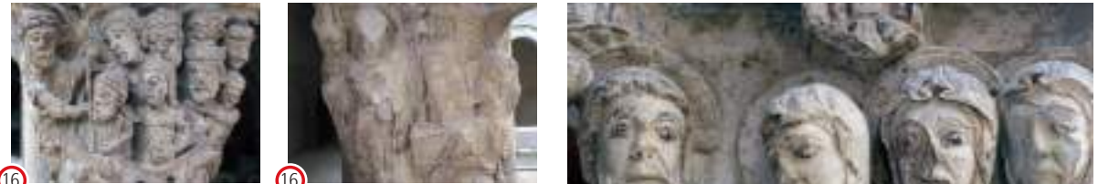
(16) (S.) Descenso al Limbo (16) (N.) Resurrección de Cristo