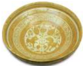
Ataífor de loza dorada